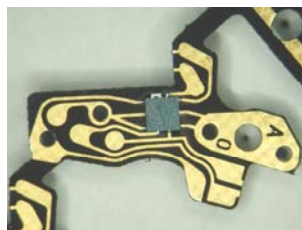
Abb. 3: Leiterplatte für elektronisches Uhrwerk mit lasergelötetem Chip