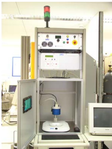
Abb. 1: Laserlötanlage mit Bearbeitungskammer (HSG-IMIT)

Durch das Projekt konnte das technisch/wirtschaftliche Einsatzprofil des temperatur-gesteuerten Laserlötens für eine breite Produktpalette durch Vergleich mit den marktüblichen Verfahren nachgewiesen werden. Dadurch konnten zahlreiche Industriefirmen – u.a. Mitglieder des projektbegleitenden Ausschusses - auf das Potenzial dieses neuartigen Verfahrens aufmerksam gemacht werden. Auf der Basis der Ergebnisse dieses Projektes und der früheren Ergebnisse wurden Prototypen einer Produktionsanlage gebaut, die sich bereits in der Phase der Markteinführung befinden.