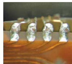
Abb. 5: Lötstellen aus Abb. 4