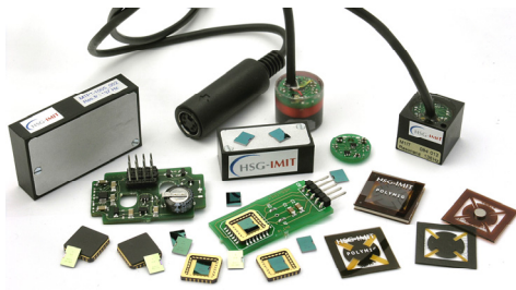
Energy Harvester Familie am HSG-IMIT

Um die vom Energy Harvester erzeugte Energie optimal speichern und nutzen zu können, benötigt man komplexe Interfaceschaltungen, die speziell an die verschiedenen Typen der Energy Harvester angepasst sind.