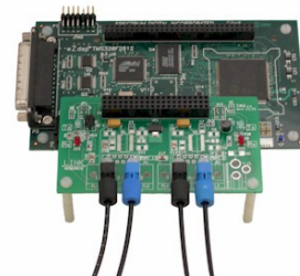
Abb. 2: DSP Board mit Schnittstellen

Bei dem in Abb. 2 dargestellten DSP handelt es sich um einen TMS320F2812 (Festkomma-Arithmetik) des Herstellers Texas Instruments. Auf ihm sollen geeignete Algorithmen entwickelt und implementiert werden, um aus den verrauschten Abtastwerten der Messelektronik hochgenaue Messwerte zu gewinnen. Insbesondere Algorithmen zur Interpolation und Filterung sinusförmiger Messsignale sind nötig, um exakte Werte für Amplitude und Phase der Messsignale zu erhalten.