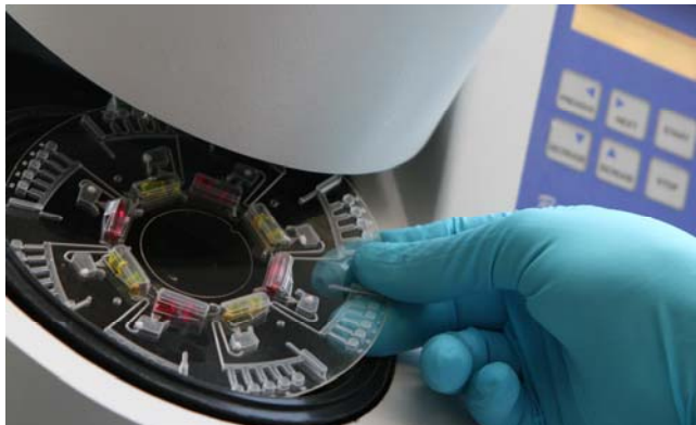
Abbildung 1: Mikrofluidisches System für die Vor-Ort-Analyse von Krankheitserreger.

Im Rahmen des Verbundprojekts „SONDE“ bieten wir eine Bachelor-/Masterarbeit auf einem sehr anwendungsnahen, aber trotzdem technisch und wissenschaftlich herausfordernden Themengebiet an. Das Projekt SONDE hat das Ziel, ein mikrofluidisches System für den Vor-Ort-Nachweis von Krankheitserreger zu entwickeln. Alle für den Nachweis nötigen Prozessschritte, wie das Mischen und Separieren oder das fluidische Schalten werden dabei in einer Foliendisk integriert (Abb. 1).